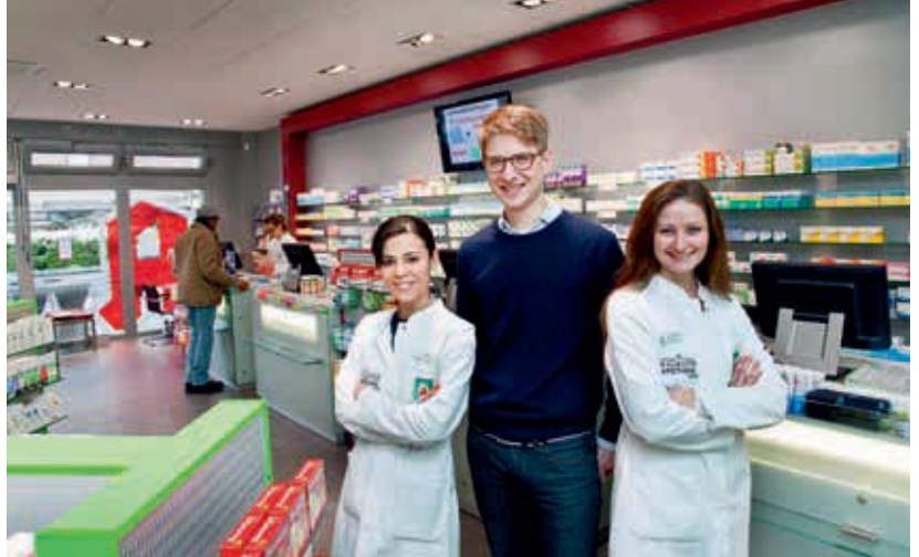
Ihre Ansprechpartner bei Thomas Reipen

Kundennähe steht in der Maubistor-Apotheke ganz oben, durch ein vollautomatisches Lagersystem bleiben die Apothekenmitarbeiter stets beim Kunden und können sich ihren Beratungsgesprächen widmen. Die Medikamente erreichen den Arbeitsplatz am